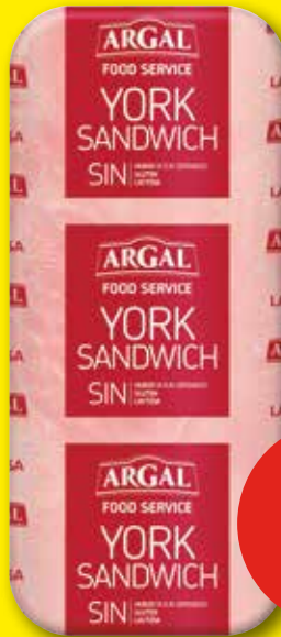
ARGAL York sandwich, el kg*

*sólo en tiendas con charcutería al corte