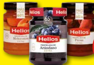
HELIOS Mermelada disitintos sabores, 340 gr