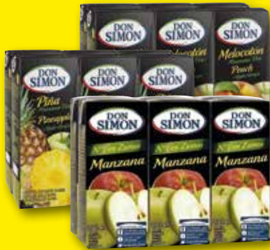
DON SIMÓN Zumo de manzana, piña y uva o melocotón y uva, pack 6 uds. x 20 cl