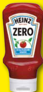
HEINZ Kêchup zero, 425 gr