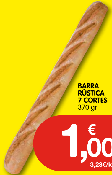
BARRA RÚSTICA 7 CORTES 370 gr