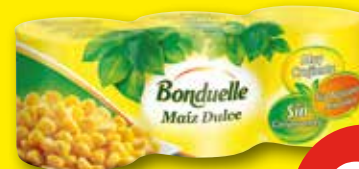
BONDUELLE Maíz dulce, pack 3 uds. x 150 gr (P.E. pack 3 uds. 140 gr)