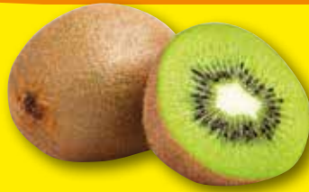
ZESPRI Kiwi verde, el kg