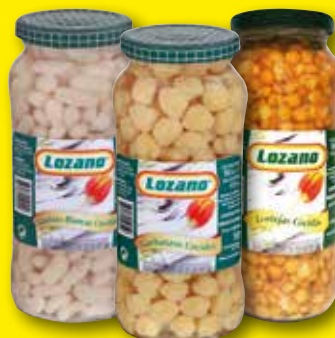
LOZANO Alubias blancas, lentejas o garbanzos cocidos, 560 gr