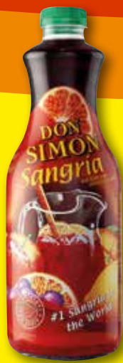
DON SIMÓN Sangría, 1,5 l