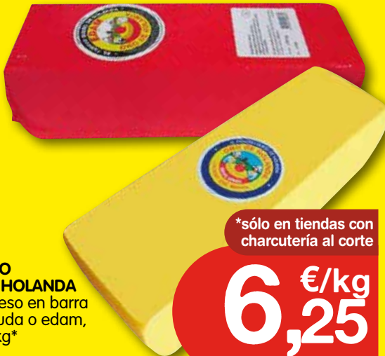
ORO DE HOLANDA Queso en barra gouda o edam, el kg*

*sólo en tiendas con charcutería al corte