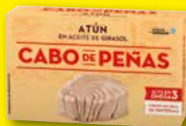
CABO DE PEÑAS Atún en aceite de girasol, 220 gr (P.E. 143 gr)