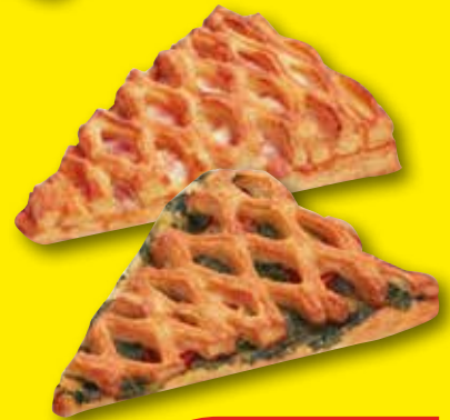
TRIÁNGULO Mixto, 133 gr o espinacas y cherry, 145 gr