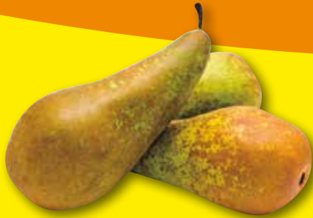
PERA CONFERENCIA el kg