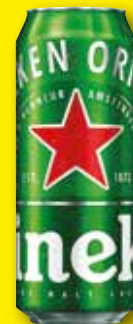
HEINEKEN Cerveza, 50 cl