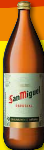
SAN MIGUEL Cerveza especial, 1 l