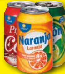
ALTEZA Refresco de cola cero o regular, naranja o limón, 33 cl