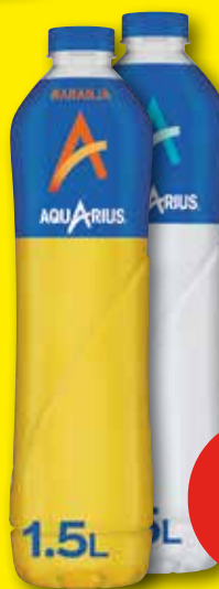
AQUARIUS Bebida isotónica de naranja o limón, 1,5 l