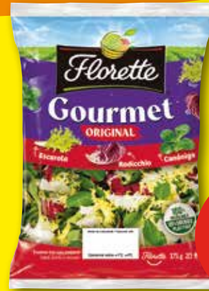
FLORETTE Ensalada gourmet, 175 gr