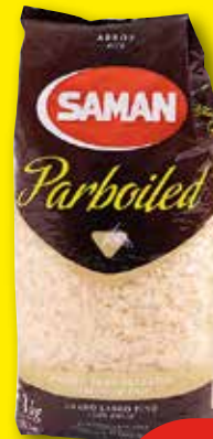
SAMAN Arroz vaporizado, 1 kg