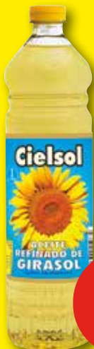
CIELSOL Aceite de girasol, 1 l