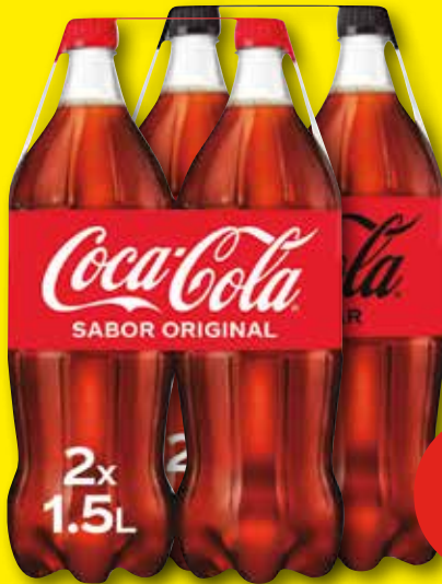
COCA COLA Refresco original o zero, pack 2 uds. x 1,5 l