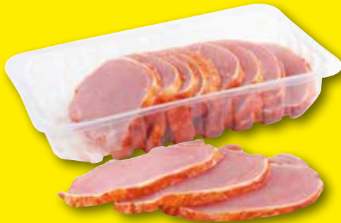
JUCARNE Lomo adobado fileteado, bandeja el kg