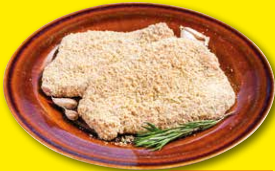
ESCALOPE DE VACUNO EMPANADO bandeja el kg