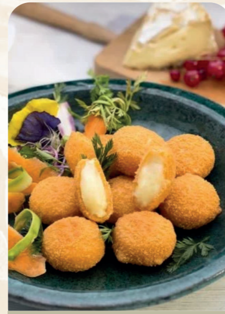
Mini camembert empanado