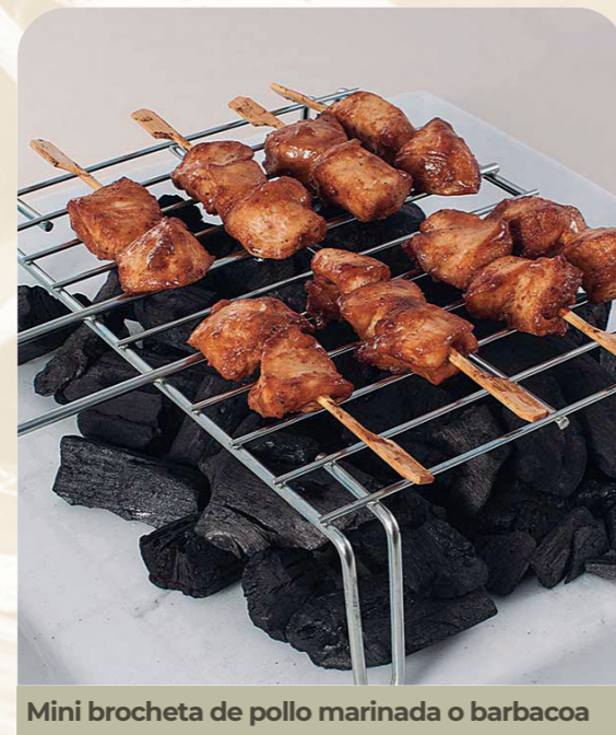
Mini brocheta de pollo marinada o barbacoa