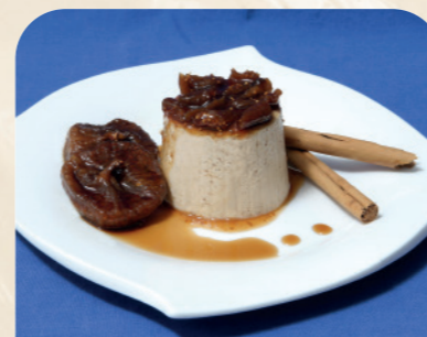
Flan de higos al Pedro Ximénez