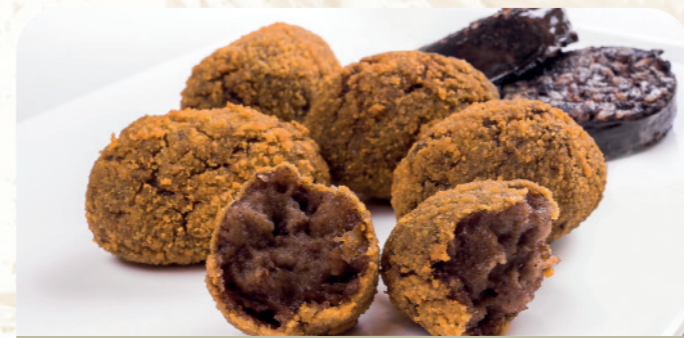
Mini croqueta de morcilla