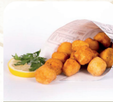
Bocadito de potón