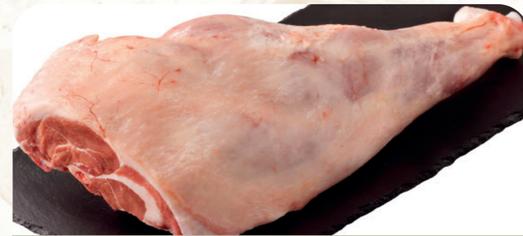
Pierna de cordero Nacional