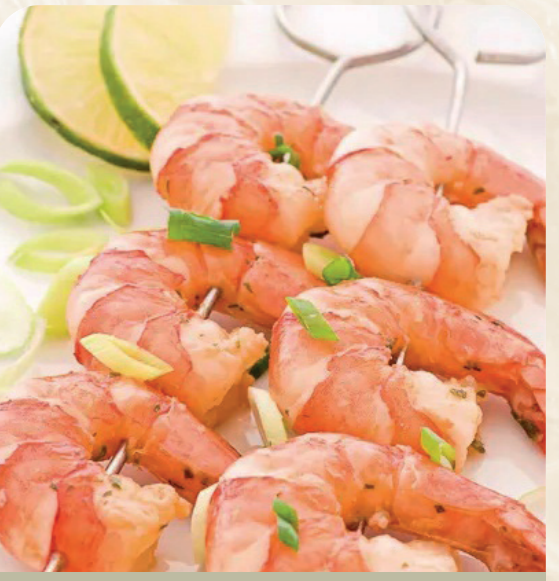
Brocheta de langostino