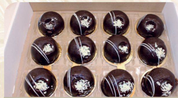
Bombón de chocolate con tocino de cielo