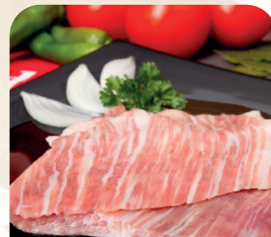
Secreto de cerdo ibérico