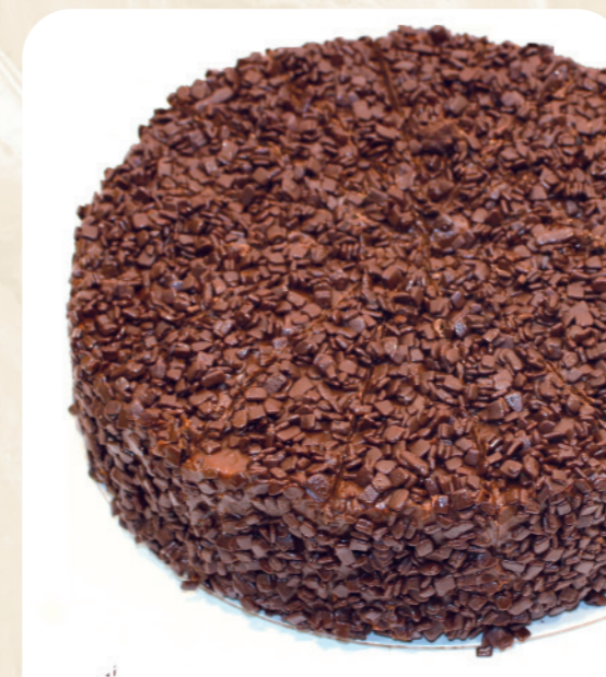
Tarta muerte por chocolate