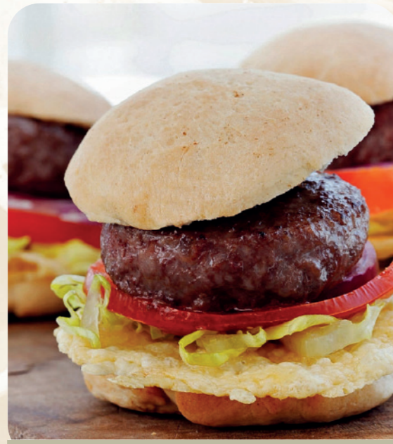
Mini hamburguesa de vacuno