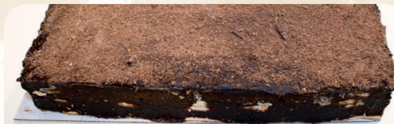
Tarta de la abuela con chocolate y galleta