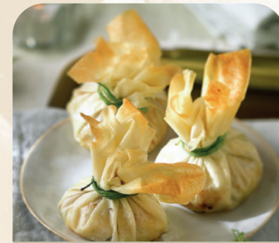
Saquito de marisco