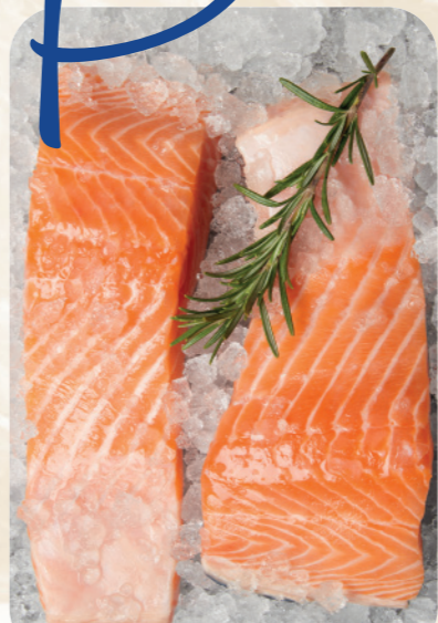
Filetes de salmón