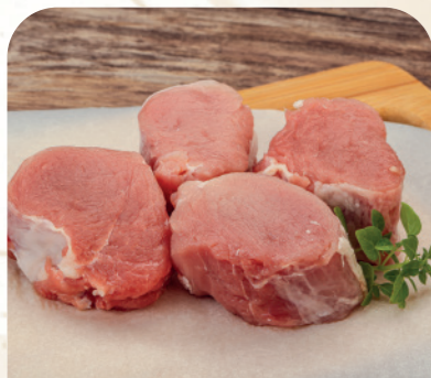
Solomillo de cerdo ibérico