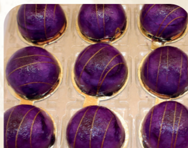
Mousse de frutas del bosque