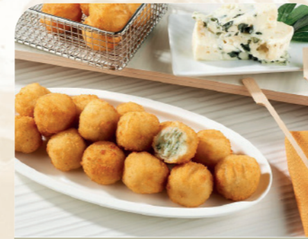
Bocadito de queso azul