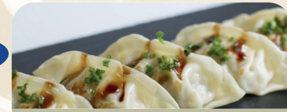
Gyozas de langostino