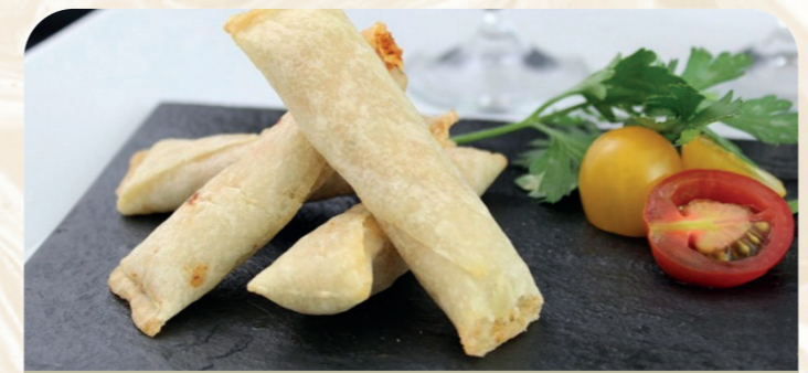
Almohadilla de morcilla con cebolla