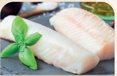
Lomos de merluza