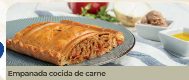
Empanada cocida de carne