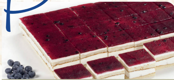
Plancha de queso con arándanos