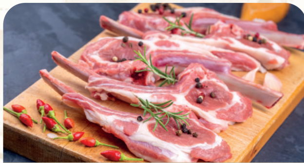
Chuletas de lechal