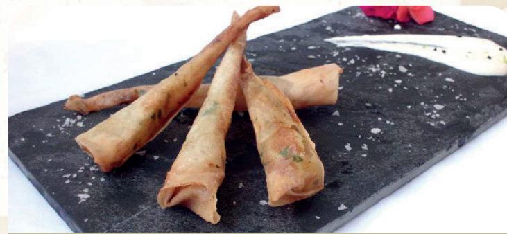
Mini twister de langostino