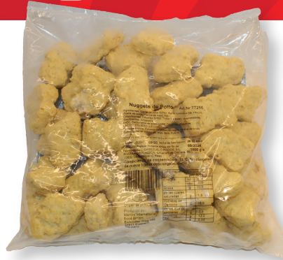
NUGGETS DE POLLO 1 KG