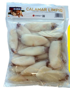
EXKIMO CALAMAR LIMPIO 10-20 800 G