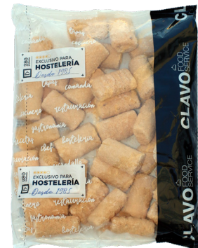
CLAVO MINI FLAMENQUINES YORK-QUESO 1 KG