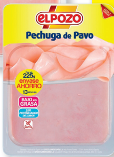
EL POZO JAMÓN COCIDO O PECHUGA DE PAVO EN LONCHAS 225 G