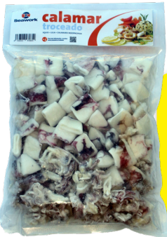
CALAMAR TROCEADO DE LA INDIA IQF 800 G