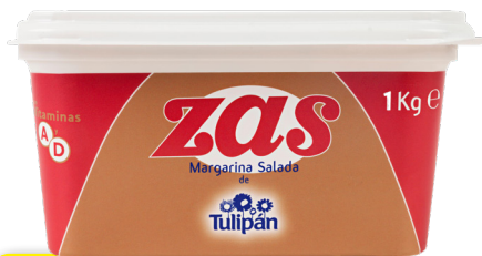
ZAS MARGARINA CON SAL 1 KG