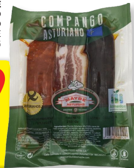
MAYBE COMPANGO ASTURIANO PAQUETE 250 G