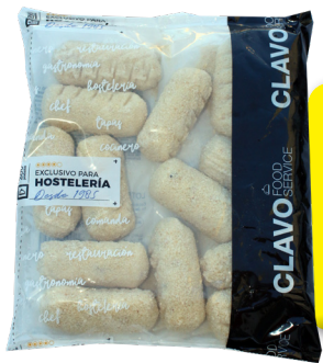
CLAVO CROQUETÓN DE JAMÓN 1 KG