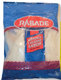
RÁBATE FILETE DE MERLUZA SIN PIEL 800 G