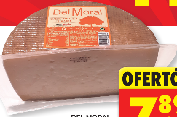
DEL MORAL QUESO CURADO MEZCLA 1/2 PIEZA EL KG