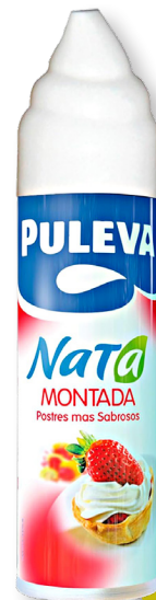
PULEVA NATA MONTADA SPRAY 500 G