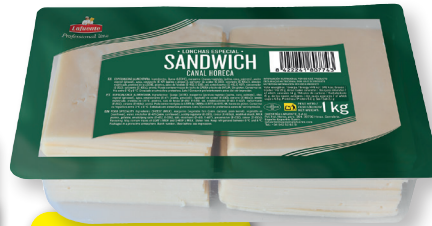
LAFUENTE QUESO SÁNDWICH EN LONCHAS 1 KG