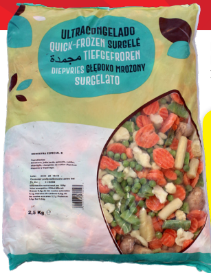
MENESTRA ESPECIAL 2,5 KG