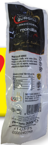
TELLO MORCILLA DE ARROZ DE BURGOS 320 G