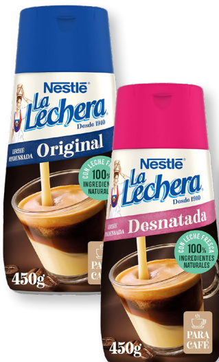
LA LECHERA LECHE CONDENSADA ORIGINAL O DESNATADA SIRVEFÁCIL 450 G