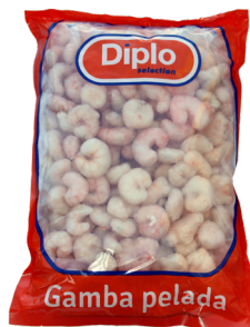
DIPLO SELECTION GAMBA PELADA 50/70 650 G