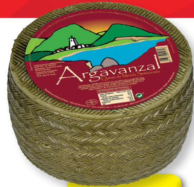
ARGAVANZAL QUESO MEZCLA SEMICURADO EL KG